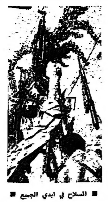
السلاح في ابي الجيب

عوقلة جهود السلام واستكر الرئيس امين الحافظ المدون البيع ، وقال : لم ننتفع اسرائيل عن استهداف لبنان بالمدون على شتى انواعه ، وخلال الونة الاخيرة ، بعد ان قشلت مخططاتها الرامية الى اصابة لبنان في مسيم كمانه ، عن طريق الزمراوات التي حاطتها لتسليح الكتل وتقليص الكتل اللبناني والوحدة الوطنية ، اذا بها ترجع الى اسلوب العدوان العسكري ، ومحاولة الاقتحام بسين الكتل والفلسطينيين ، فلذا بها نلجئ عكس ما ارايت ، واذا بانتزاج جهاد الاشقاء يزيد من تضامهم ووجدهم . واضاف : ان القدر الذي يجب ان يلقفه كل لبناني وكل عربي من هذا العدوان هو ضرورة نيل التفرقة